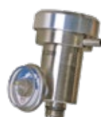
Regulador de Vazão por Demanda

Para receber uma lista completa de kits e acessórios, contate a LEL Ambiental.