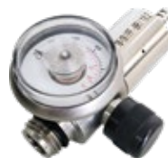
Regulador de Vazão Fixa