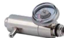
Regulador Push Botton para Bump Test