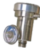
Regulador de Vazão por Demanda

Para receber uma lista completa de kits e acessórios, contate a LEL Ambiental.