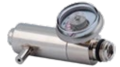
Regulador Push Botton para Bump Test