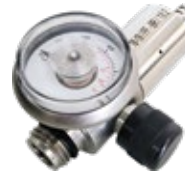
Regulador de Vazão Fixa